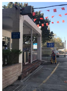
深圳海星港口发展有限公司张贴公示