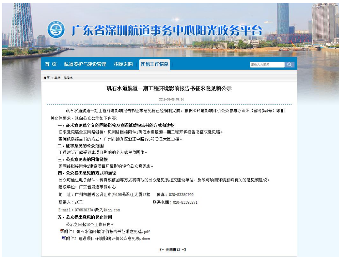
图 3-2 征求意见稿公示（广东省深圳航道事务中心）网站截图