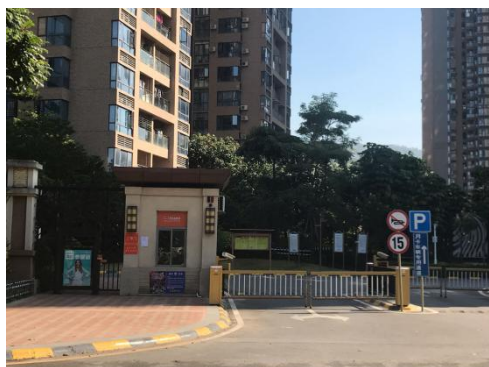
佳兆业美好小区张贴公示