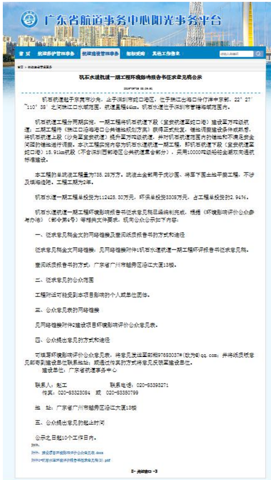
图 3-1 征求意见稿公示（广东省航道事务中心）网站截图